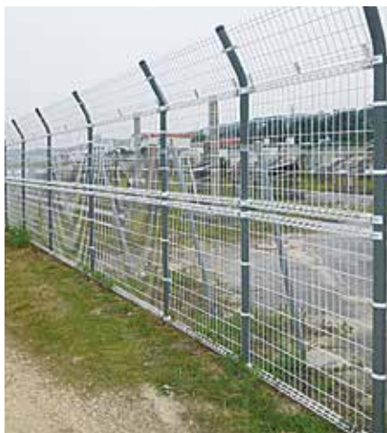
各種フェンス支柱