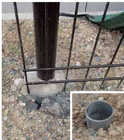
フェンス施工用鋼管杭