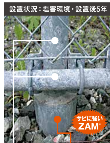
HDZT77(HDZ55) ZAM ® 製鋼管杭