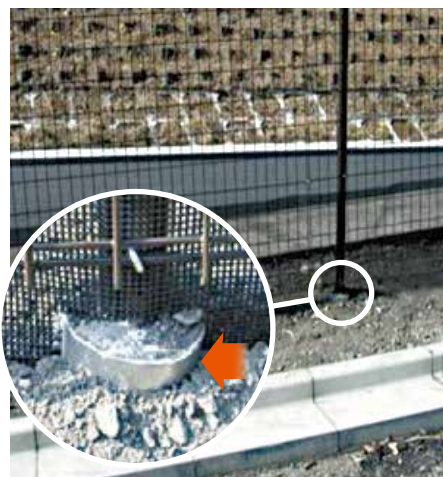
各種フェンス用鋼管杭