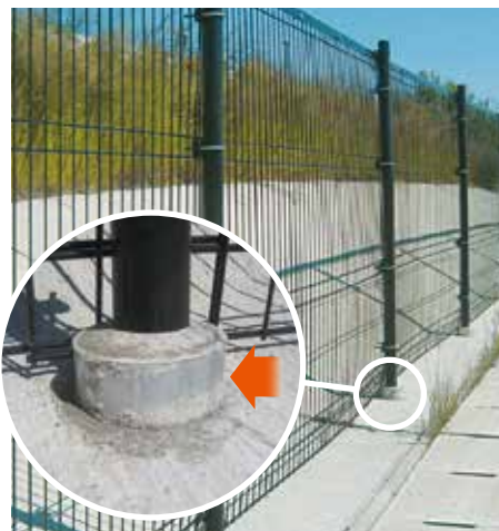
各種フェンス用鋼管杭