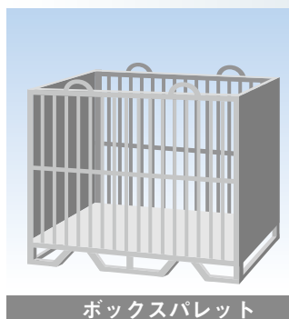
ボックスパレット