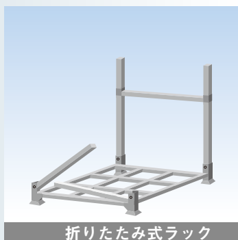
折りたたみ式ラック