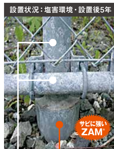
設置状況: 塩害環境・設置後5年 HDZ 55 ZAM ® 製鋼管杭