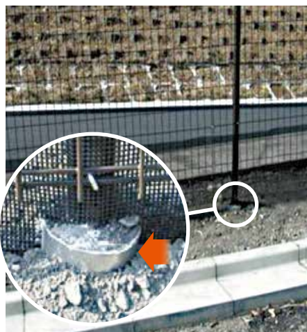
各種フェンス用鋼管杭